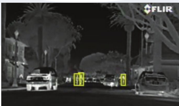
Obraz z PathFindIR II z wbudowaną analityką

Kiedy widzisz dalej, masz więcej czasu na reakcję. Więcej czasu oznacza więcej możliwości, pewniejsze prowadzenie samochodu w nagłej sytuacji oraz więcej miejsca na zahamowanie. PathFindIR II pozwala uniknąć zdarzeń drogowych. Używając go szybko zauważysz pieszych, samochody, zwierzęta i wiele innych zagrożeń pojawiających się po obu stronach pasa drogowego.